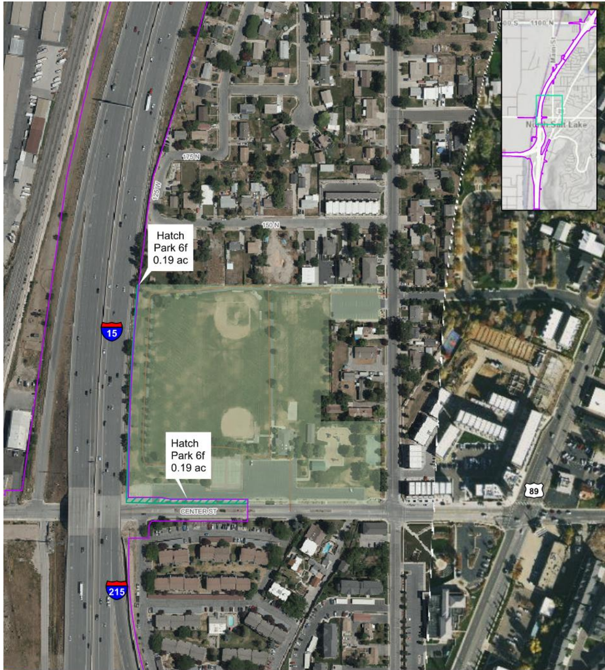
Figura 5.5-2. Impactos previstos en el artículo 6(f) sobre Hatch Park